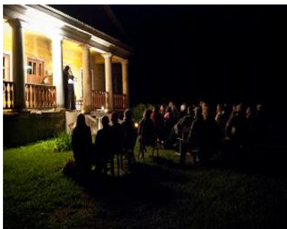
Zvaigžņotās nakts koncerts 2012.gada 11.augusta naktī