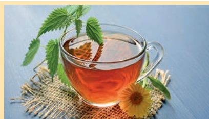
Tēju nevajag lietot ilgstoši, kā arī grūtniecības un bērna zīdīšanas laikā!