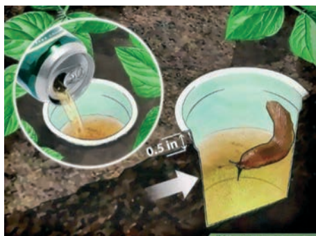
Visbiežāk slīcināšanas slazdos par pievilinātājienu izmanto alu.

Visbiežāk slīcināšanas slazdos par pievilinātājienu izmanto alu. Ja slazdos būs tikai tīrs ūdens, gliemeži var ātri no tā izlīst ārā. Tāpēc šķidrumam ir jāsaturs vielas, kas veicina gliemežu noslīkšanu — 1% vara (vara sulfāts) vai 10% vārāmā sāls šķīdums.