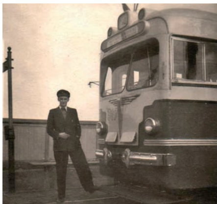
Farmācijas students – tramvaja vadītājs. Dailonis gadu bija atslēdznieks nakts vaģonu profilaksē, pēc tam gandrīz 4 gadus – tramvaja vadītājs. 1955. gads.

"Vislielāko gandarījumu izjūtu par to, ka nepaliku gružčiks (krāvējs), bet tomēr ieguvu augstāko izglītību, ieguvu profesiju, kurā, pats vismaz tā ceru, esmu ieguvis savu darbības nišu – ārstniecības