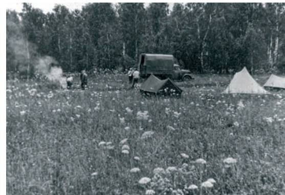
Tipiska ekspedīcijas nometne, gandrīz katru dienu citā vietā. 1968.–1973. gads.