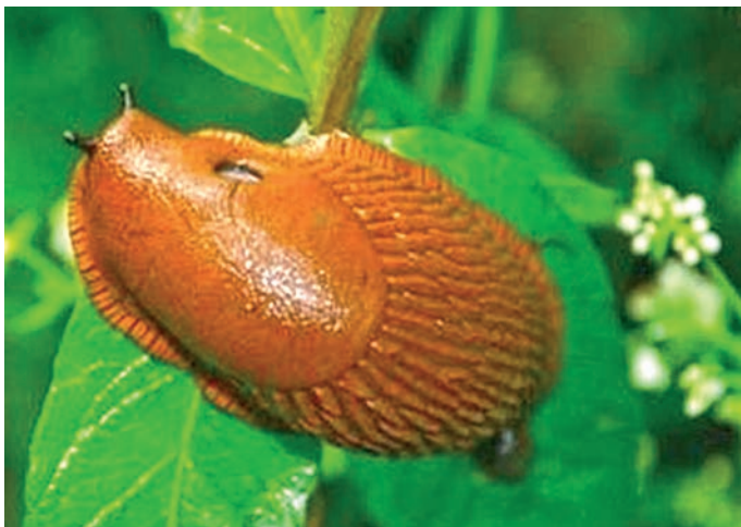
Spānijas kailgliemezi ( Arion lusitanicus )

Paplašinājusies Spānijas kailgliemeža izplatība Latvijas teritorijā, kas ievazāta ar stādiem, pie kuru saknēm atrodas gliemeža oļiņas. Līdz ar stāda iestādīšanu gliemezis veiksmīgi iedzīvojas dārzos un caur ceļmalām, grāvmalām un