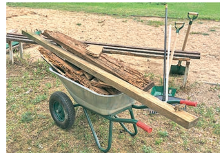
Rakstā projektu īstenošanu foto