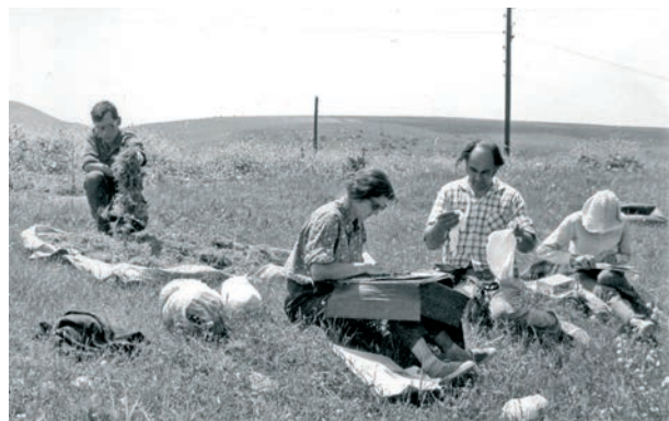
Ekspedīcijas darba moments, savākto materiālu apstrāde. 1968.–1973. gads.